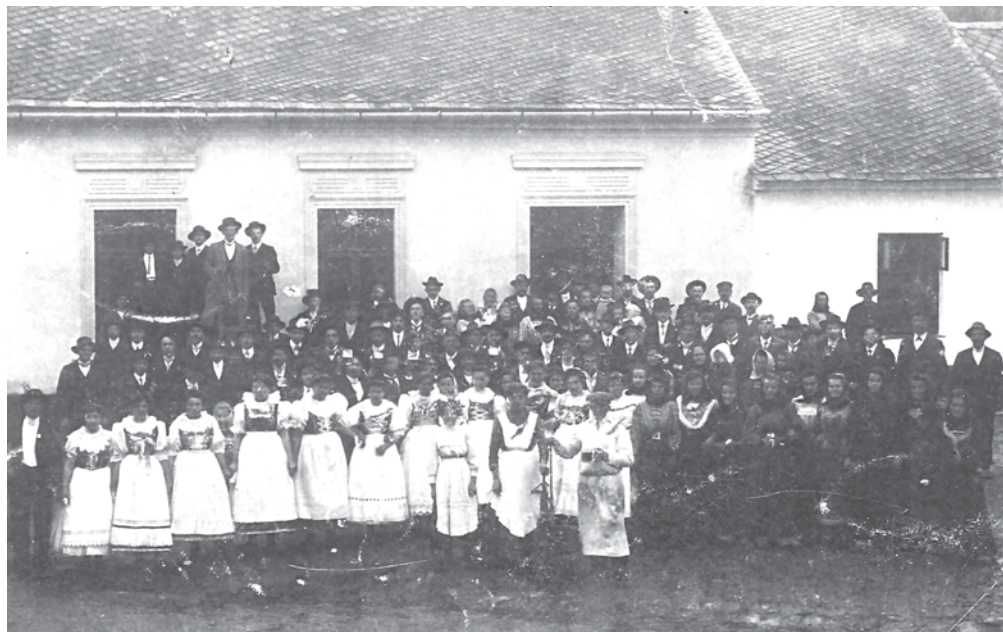
Historický snímek účastníků hodů pravděpodobně z roku 1911. Hody bývaly třídní slávou s hodovou zábavou každý den. Taneční veselí začínalo odpoledne a probíhalo až do nočních hodin.